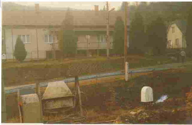
priestor pri Obecnom úrade