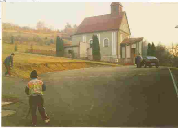
LOKALITA 2 priestor pred kostolom