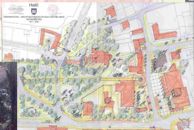
urbanisticko-architektonická štúdia centra obce - axonometria