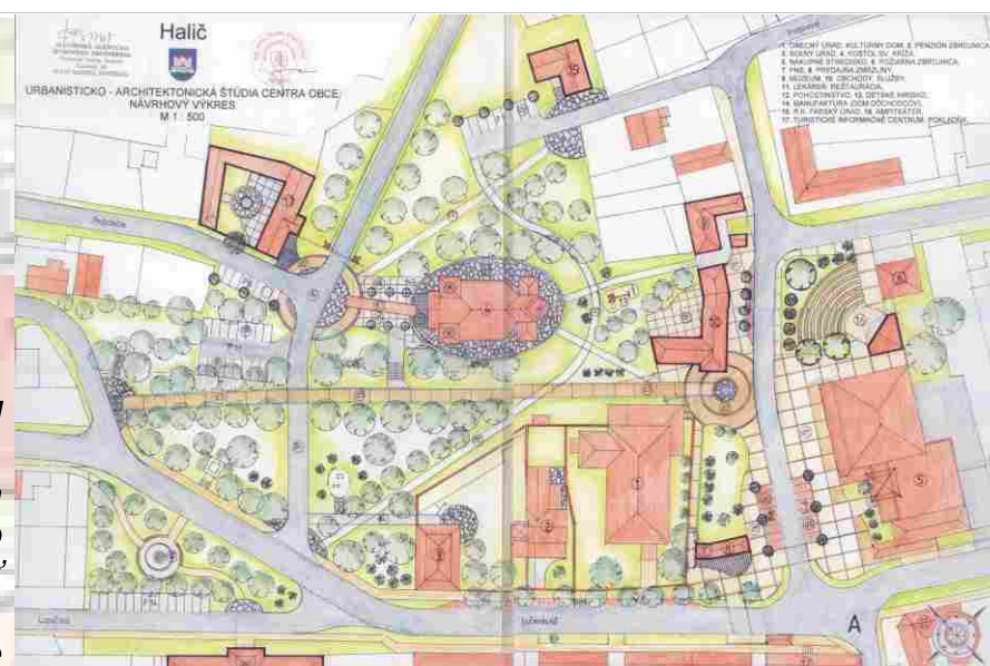
urbanisticko-architektonická štúdia centra obce návrhový výkres