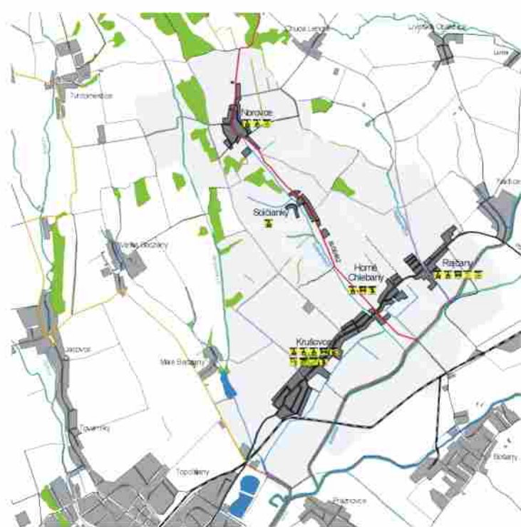
Kultúrno - historický potenciál

V ďalšom štádiu bude potrebné cyklotrasu legalizovať, dobudovať povrch, sprejzdniť trasu vedenú po pravostrannej hrádze rieky Bebrava a celú trasu vyznačiť.