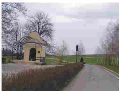
Pútnické miesto - Mechovička