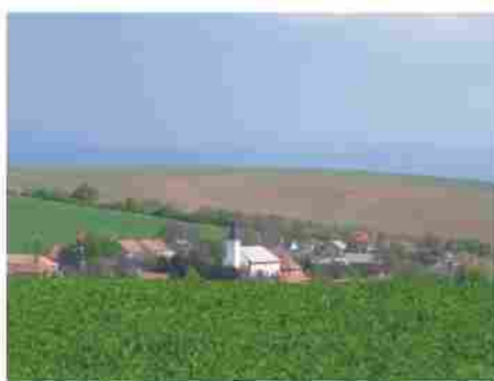
Pohľad na obec Norovce