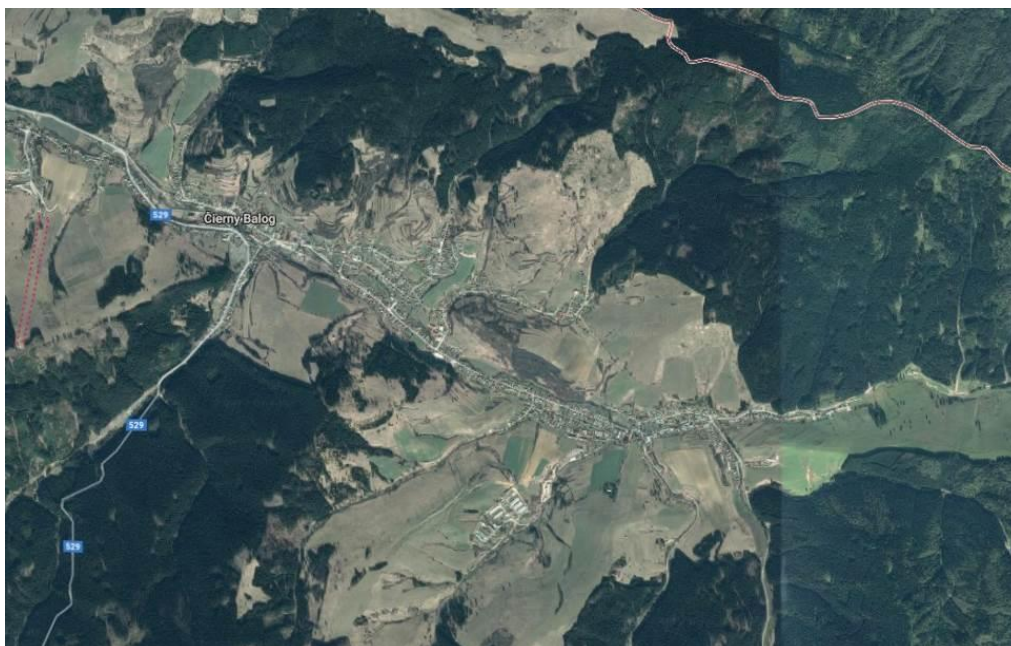
MAPA 6.1 - Letecký snímok na obec ČIERNY BALOG